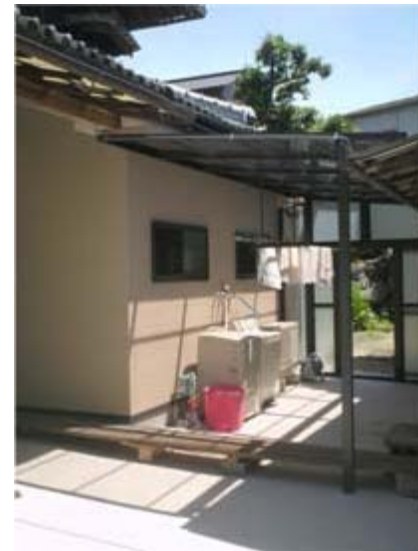
増築部分と中庭スペースを確保