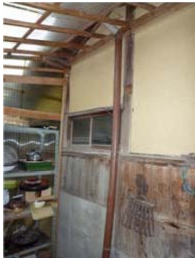
土壁は剥がれている また地盤が沈んでいる